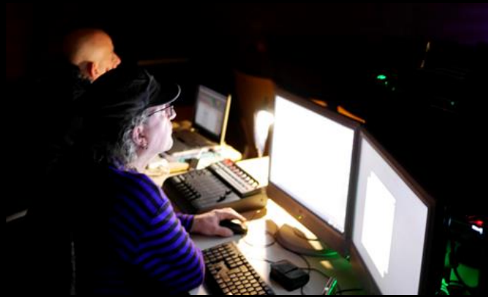
“BERTSE”: Claustro del Museo Vasco de Bilbao. Proyección mapping sobre el suelo

Su deseo desde hace tiempo es realizar una propuesta con visión de futuro a nuestro entorno que se base en la investigación tecnológica I+D desde el punto de vista del arte y el espectáculo.