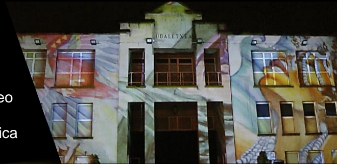
“8M”: Ayuntamiento de Sopelana (Bizkaia) Proyección mapping arquitectónica