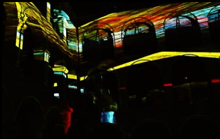
“FRAKTAL”: Claustro del Museo Vasco de Bilbao. Proyección mapping arquitectónica